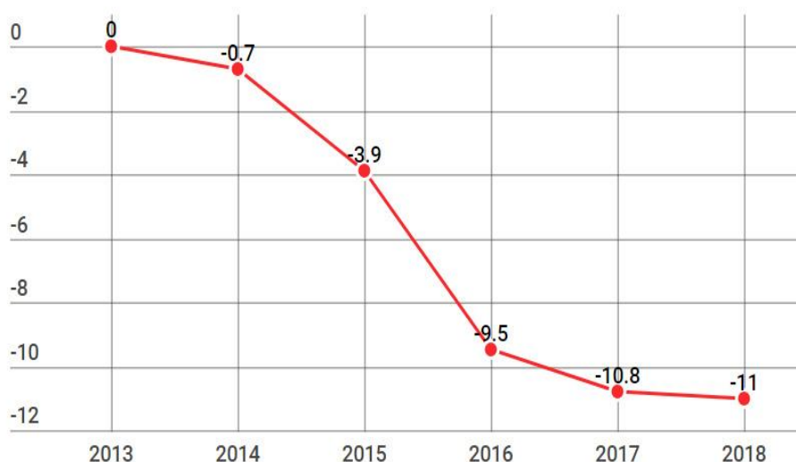
Рисунок 1. Реальные доходы населения России с 2013–2018 гг., % (составлено авторами)

По данным Министерства здравоохранения РФ продолжительность жизни россиян по состоянию на 2019 год увеличилась до уровня 73 лет. На рисунке 1 представлены данные о реальных доходах населения России с 2013–2018 гг.