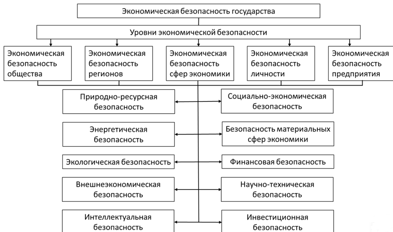
Рисунок 4. Экономическая безопасность государства (составлено автором на основе источника [13])

Взаимосвязь между экономической безопасностью России и её регионов является ключевым элементом для понимания общенациональной стабильности. В экономической литературе часто поднимаются вопросы о базовых элементах экономической безопасности страны, однако вопросы региональной экономической безопасности до сих пор остаются недостаточно освещенными и требуют дополнительного исследования (рис. 4).