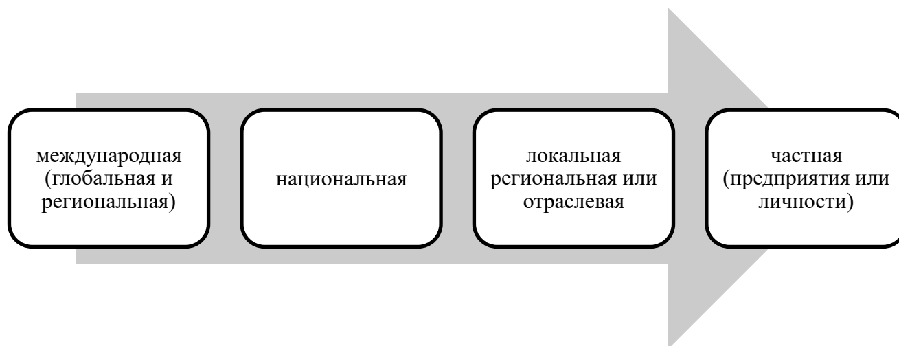
Рисунок 2. Уровни экономической безопасности (составлено автором на основе источника [11])

В литературе по экономической безопасности часто встречается выделение нескольких её уровней (рис. 2).