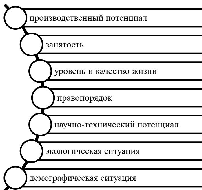
Рисунок 3. Аспекты экономической безопасности региона (составлено автором на основе источника [12])

Взаимосвязь между экономической безопасностью России и её регионов является ключевым элементом для понимания общенациональной стабильности. В экономической литературе часто поднимаются вопросы о базовых элементах экономической безопасности страны, однако вопросы региональной экономической безопасности до сих пор остаются недостаточно освещенными и требуют дополнительного исследования (рис. 4).