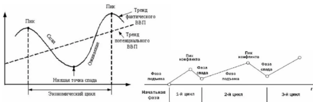
Рисунок 1. Фазы экономического цикла (составлено автором)

Обратим внимание на то, что в российской учебной литературе выделяют четыре фазы экономического цикла: кризис, депрессию, оживление и подъем (рис. 1), а в зарубежной часто предлагают только две фазы: рецессию и подъем.