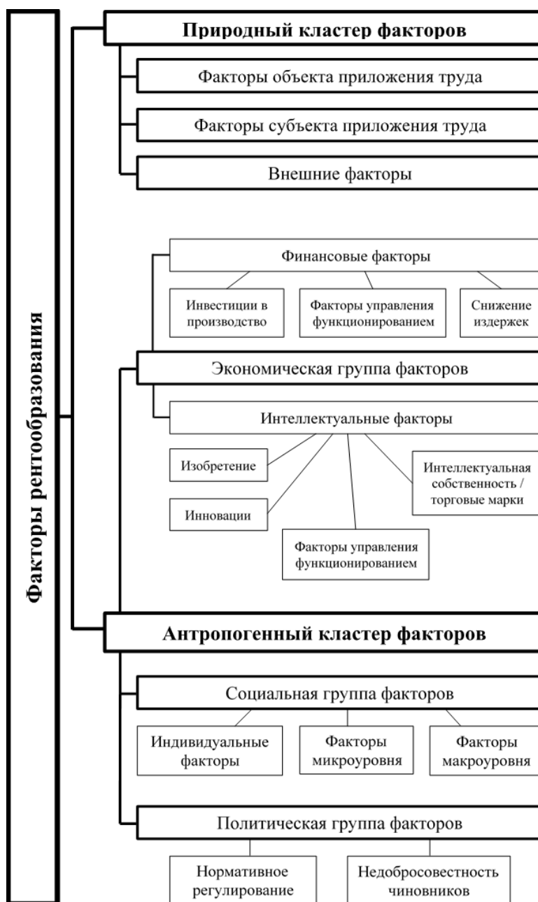
Рисунок 1. Классификация факторов рентообразования (составлено автором)

На основании проведённого выше анализа факторов рентообразования, нами предлагается классификация факторов рентообразования (рис. 1).