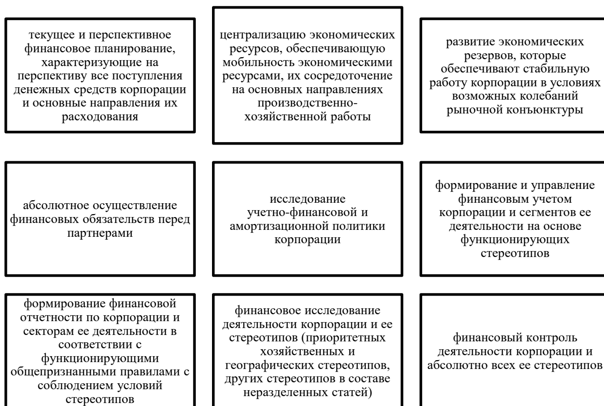
Рисунок 1. Основные элементы финансовой стратегии корпорации (составлено автором)

Основные элементы финансовой стратегии корпорации перечислены на рисунке 1.