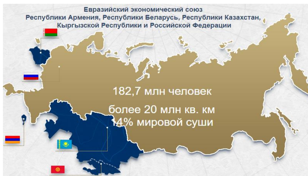
Рисунок 1. Карта государств-членов ЕАЭС 2

Стоит отметить, что многими авторами исследуются вопросы использования различных программных средств, способных повышать привлекательности морских портов на внешних границах ЕАЭС и транзитного потенциала Союза таких например, как комплекс программных средств (КПС) «Портал Морской порт» [4].