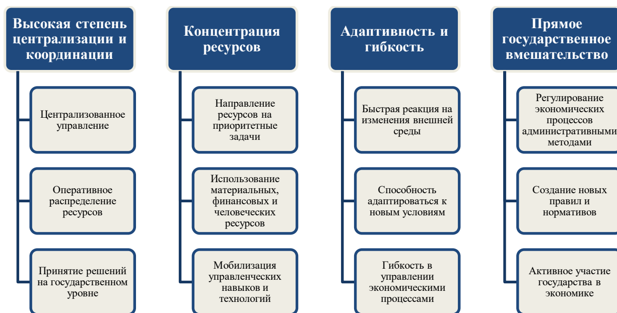
Рисунок 1. Основные особенности мобилизационной экономики относительно влияния на организации (разработано автором)

Исходя из проведенного анализа сущности мобилизационной экономики, обозначим схематично основные факторы влияния этой модели экономики на организации (рис. 1).