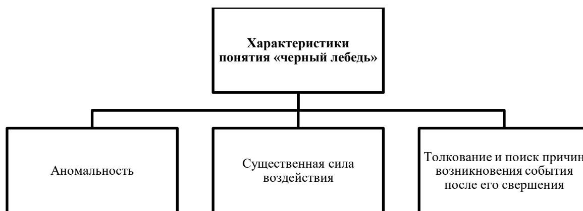
Рисунок 1. Характеристики понятия «черный лебедь» по трудам Н. Талеба 1

Концепция Черного лебедя была впервые предложена американским публицистом, философом и экономистом Н.Талебом в его одноименном труде. Обобщая выводы исследователя, Черным лебедем можно назвать редкое, крайне важное и непредсказуемое событие, что оказывает существенное влияние на социально-экономическое развитие общества (рис. 1).