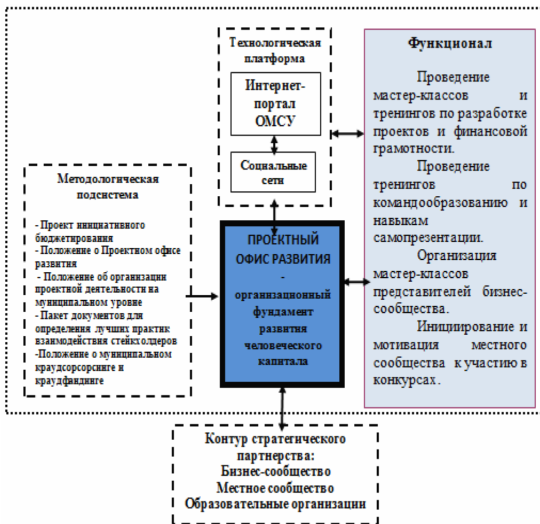
Рисунок 3. Детализация инфраструктуры «Проектного офиса развития» – организационного фундамента развития человеческого капитала на муниципальном уровне (разработано автором)

Разработанная модель способствует воспроизводству и амортизации человеческого капитала, создает предпосылки для стремления к новому уровню организации жизни территории – «обучающей территории». Это место, где представители местного сообщества и организации заинтересованы в изучении динамической структуры своего окружения, осмысливают свои достижения и гибко реагируют на угрозы в рамках стратегии развития; где на этой основе перманентно изменяются сами инструменты образования, используются все возможности работы и досуга; где жителей поощряют учиться; территория отличается стратегическим видением, креативностью, воображением и интеллектом, способностью успешно развиваться в быстро меняющейся социально-экономической среде [9, 10]. Также отметим еще один аспект: данная модель инфраструктуры создает базу для развития человеческого капитала муниципального образования не только с точки зрения «умений, знаний, навыков и способностей тех людей, которые живут на его территории, но и тех, которые заинтересованы в развитии этого муниципального образования и предпринимают какие-либо действия для этого [11]». Имеем в виду контур стратегического партнёрства, включающий заинтересованных стейкхолдеров – местное сообщество (носитель человеческого капитала), образовательные организации, объекты бизнес-среды, расположенные не только на территории данного муниципального образования, но и во вне, а также другие муниципальные образования в рамках программ межмуниципального сотрудничества.