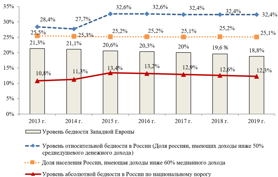
Рисунок 1. Сопоставление уровня бедности России со странами Западной Европы в 2013–2019 гг., в % [17]

Обобщая приведенные методики оценки уровня бедности, можно предложить сводный график относительного и абсолютного уровня бедности в Российской Федерации в сравнении с уровнем бедности стран Западной Европы (рис. 1).