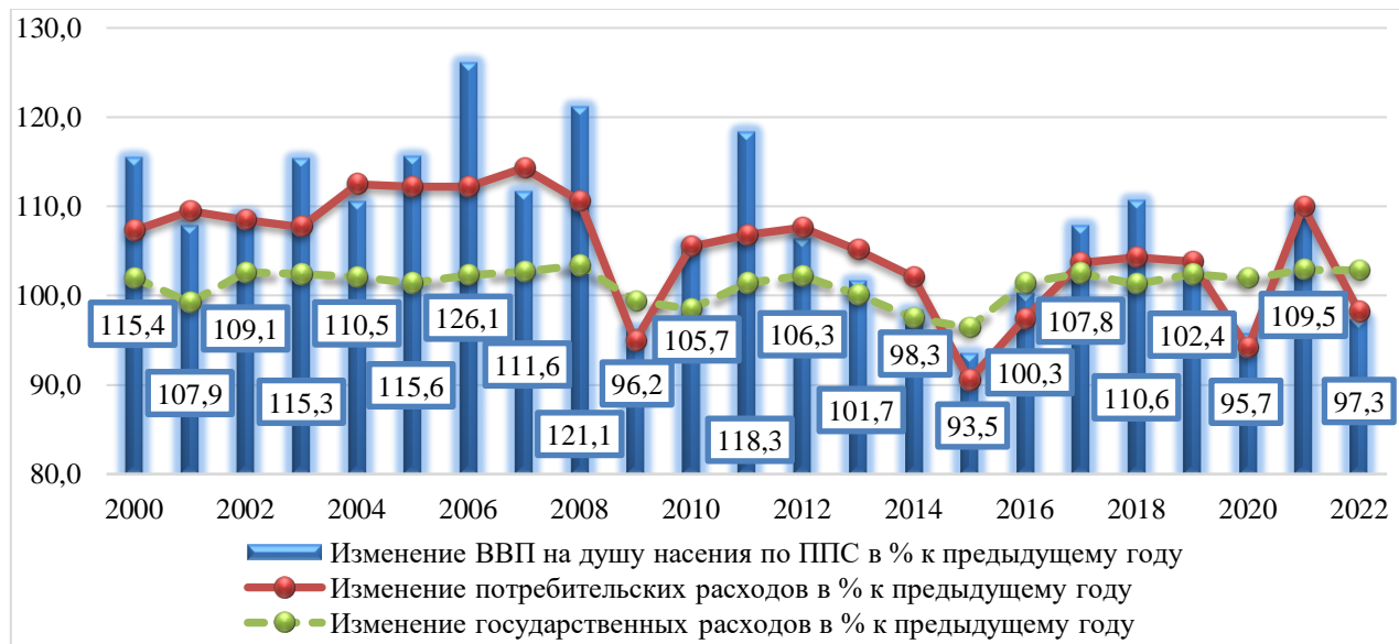
Рисунок 3. Динамика базовых макроэкономических показателей РФ в 2000–2022 гг., % (составлено по данным Росстата 5 , расчеты авторов)

Из приведенного графика видно, что 50 % населения, живущего за чертой бедности, составляют граждане, занятые в воспроизводственном процессе, которые в процессе своей трудовой деятельности реализуют свой накопленный капитал и в дальнейшем формируют совокупный конечный спрос, рост которого создает дополнительный резерв рентабельности производства.