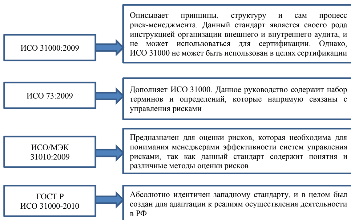
Рисунок 1. Стандарты по организации управления рисками (составлено авторами на основе [12])

Этапами реализации риск-менеджмента в организации являются: