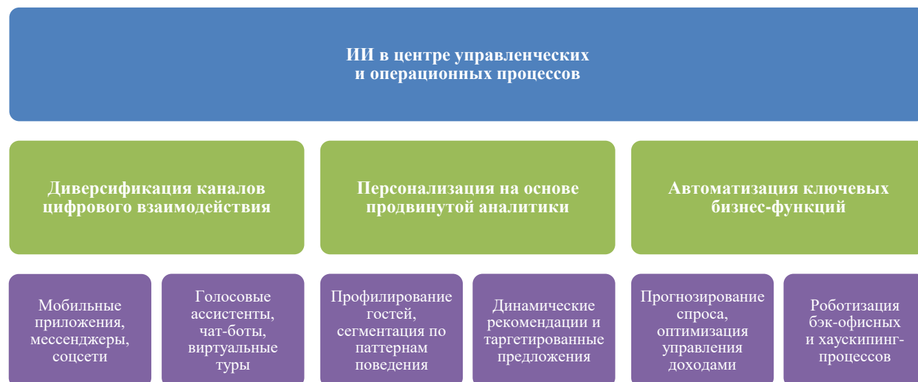
Рисунок 5. ИИ-центричная трансформация бизнес-модели гостиничных предприятий (составлено автором на основе [22])

Обобщая приведенный анализ, можно заключить, что для сохранения конкурентоспособности в новой технологической реальности гостиничным предприятиям предстоит качественно переосмыслить свою бизнес-модель, поставив ИИ в центр управленческих и операционных процессов.