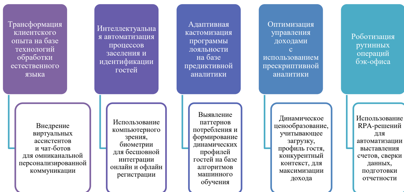
Рисунок 2. Приоритетные направления интеграции ИИ для повышения конкурентоспособности AMAKS Hotels & Resort (составлено автором на основе [18–20])

Трансформация клиентского опыта на базе технологий обработки естественного языка предполагает внедрение виртуальных ассистентов и чат-ботов для выстраивания персонализированных коммуникаций с гостем на всех этапах его пути. Как показывают кейсы Hilton и Marriott, голосовые помощники и текстовые боты позволяют не только предоставлять справочную информацию, но и помогать клиенту планировать активности в дестинации, оптимизировать процедуру выезда, получать обратную связь. За счет анализа диалоговых данных алгоритмы машинного обучения способны выявлять скрытые потребности гостя, прогнозировать его поведение и формировать проактивные предложения дополнительных услуг.