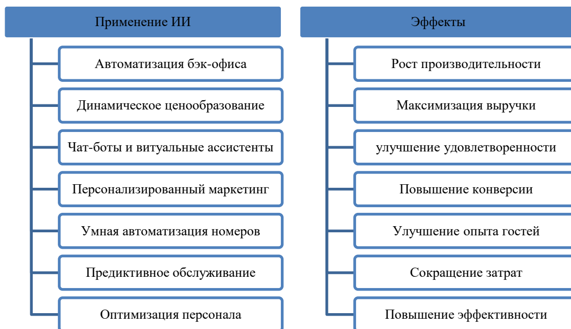
Рисунок 1. Ключевые эффекты применения ИИ в гостиничной индустрии (составлено автором на основе [9–11])

На основе систематизации указанных направлений применения искусственного интеллекта можно выделить ключевые эффекты его внедрения для предприятий гостиничной индустрии (рис. 1).