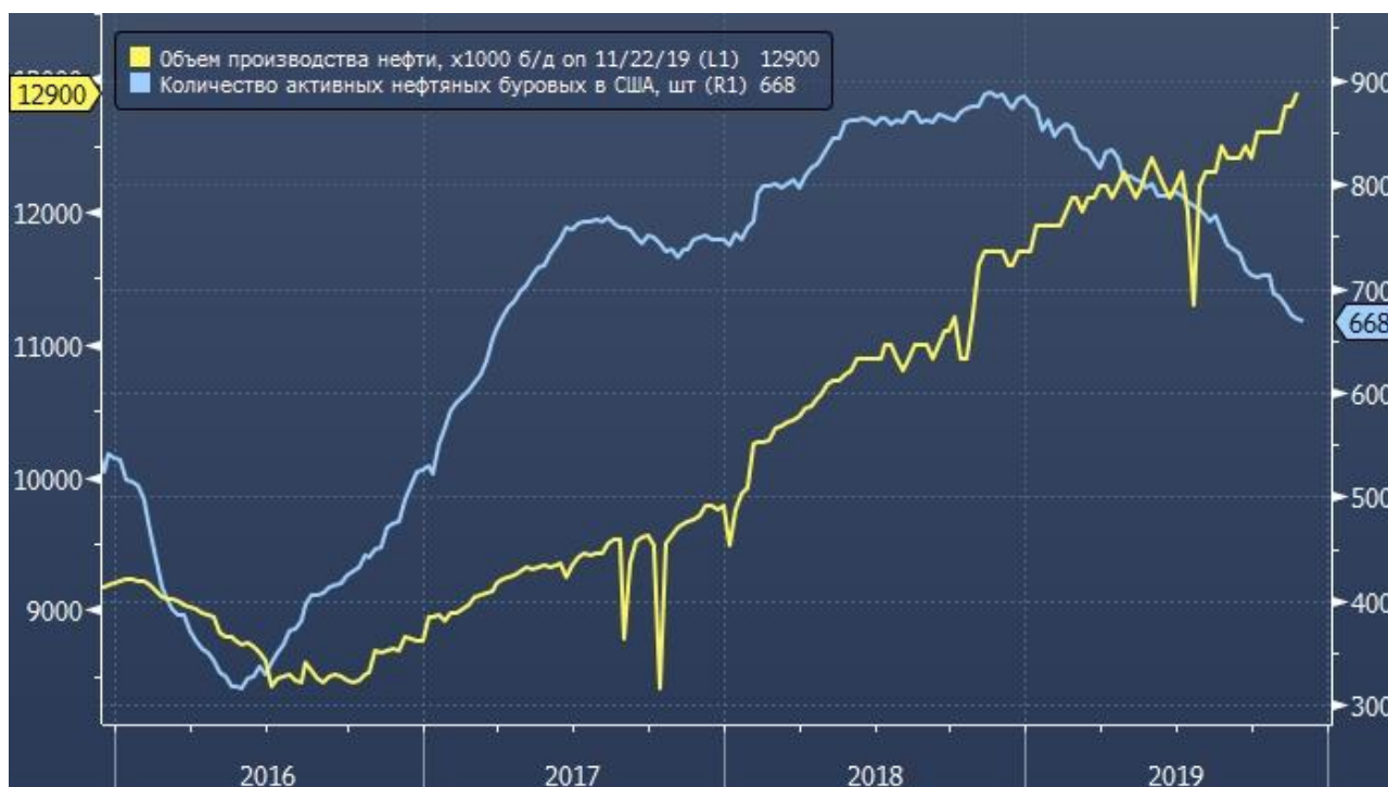
Рисунок 1. Объем производства нефти б/д и количество активных нефтяных буровых вышек в США (2016–2019 гг.) 1

В 2019 г. США вышли на 1 место в мире по добыче нефти с объемом 12,9 млн баррелей в день (далее – б/д) (рис. 1), обойдя по этому показателю Саудовскую Аравию и Россию. США удалось нарастить экспортные поставки до уровня 2 млн б/д благодаря добровольным ограничениям по уровню добычи, которые были взяты на себя основными мировыми производителями нефти в рамках соглашения ОПЕК+ (страны-члены ОПЕК+ 11 стран производителей нефти, не входящих в картель). Выход Российской Федерации из этого соглашения стал защитной реакцией против нарастающей угрозы масштабного переформатирования мирового рынка нефти, при котором мог быть реализован сценарий по выдавливанию нашей страны с основных рынков сбыта.