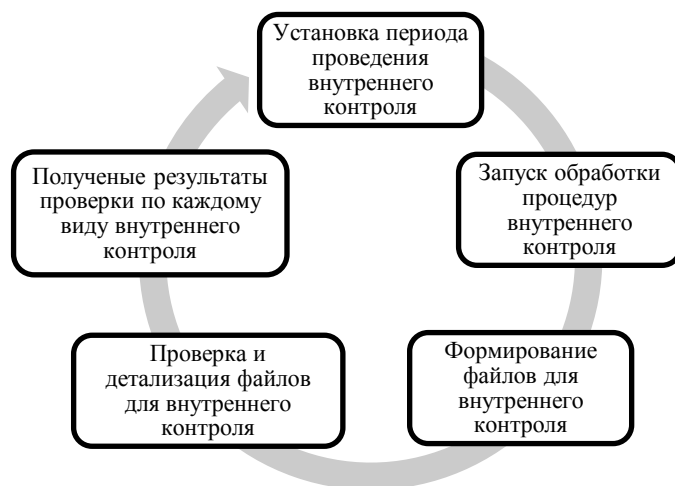
Рисунок 2. Цикл проведения процедур внутреннего контроля на платформе «1С:Предприятие 8» (разработано автором)