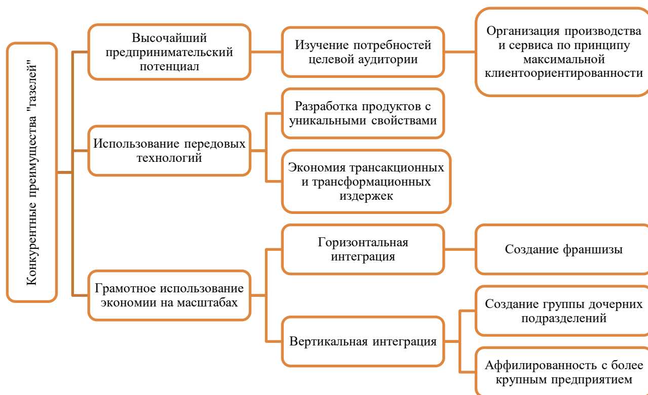
Рисунок 2. Конкурентные преимущества «газелей» (составлено автором на основе [9; 10])

Вопрос использования технологических новшеств имеет несколько ключевых направлений их применения [11]: