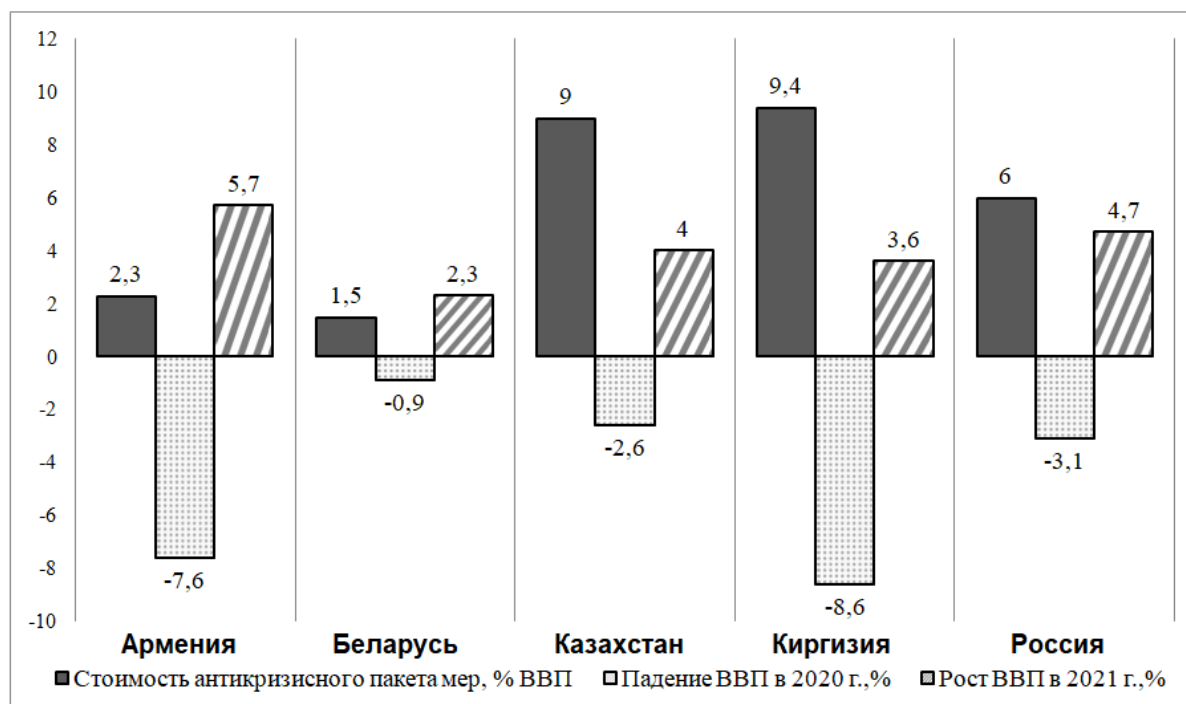
Рисунок 2. Антикризисные меры стран-членов ЕАЭС

Безусловно, в условиях падения экономической активности недостаток выделенных средств во многом препятствовал сглаживанию негативных последствий пандемии, что привело к падению ВВП в кризисном 2020 году. Однако, как и в случае с общим числом мер, между их стоимостью и экономическими результатами не наблюдалось очевидной зависимости. Более того, в отдельных случаях результат был обратным. Так, в Киргизии, где был реализован наибольший по стоимости антикризисный пакет (9,4 % ВВП), наблюдалось самое значительное падение ВВП среди стран-членов ЕАЭС. Стоит также отметить, что не наблюдается прямой связи и между объемом финансовой помощи и экономическим ростом союзных стран в 2021 году.