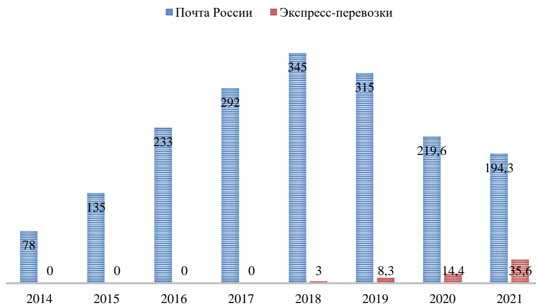
Рисунок 1. Количество отправок с товарными вложениями из зарубежных интернет-магазинов (млн) в 2017–2021 гг. 4

Данная диаграмма отображает объем количества товарных вложений из зарубежных интернет-магазинов, перемещаемых через таможенную границу ЕАЭС международных почтовых отправок (МПО) и с помощью экспресс-перевозчиков с 2014 по 2022 год. Важно отметить, что в 2018 году методика расчета была изменена, поэтому лишь с 2018 года иностранные товары интернет-торговли, перемещаемые экспресс-перевозчиками, выделены в отдельную категорию.