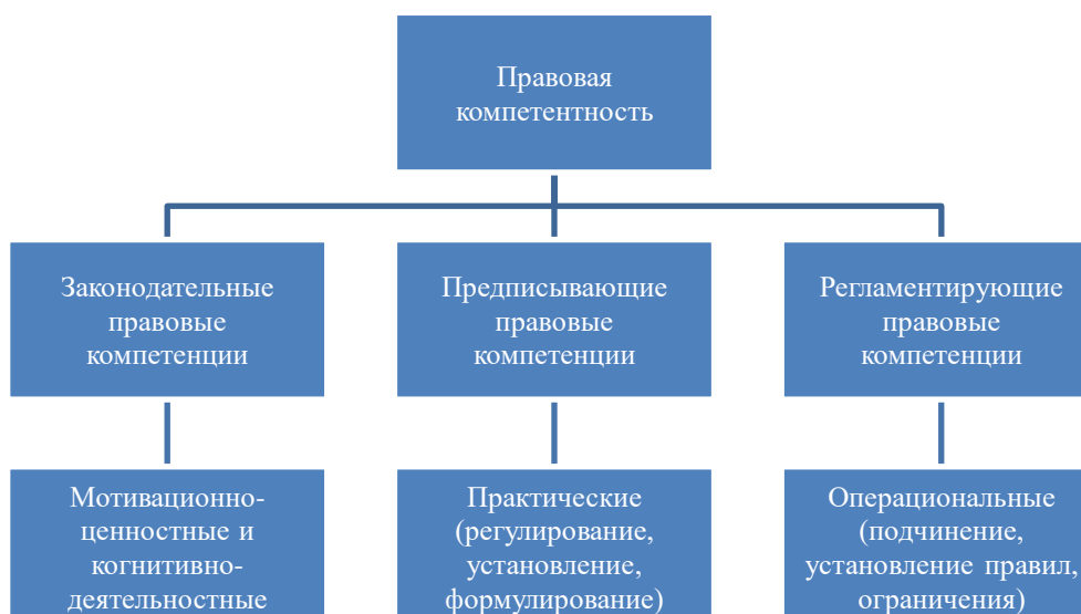
Рисунок 2. Состав правовой компетентности госслужащих (составлено автором)

Развитие — это преобразование, трансформация в новое, более совершенное состояние. Развитие компетентности — это положительная динамика таких качеств, как профессиональная и индивидуальная компетентности под влиянием ряда внешних и внутренних факторов.