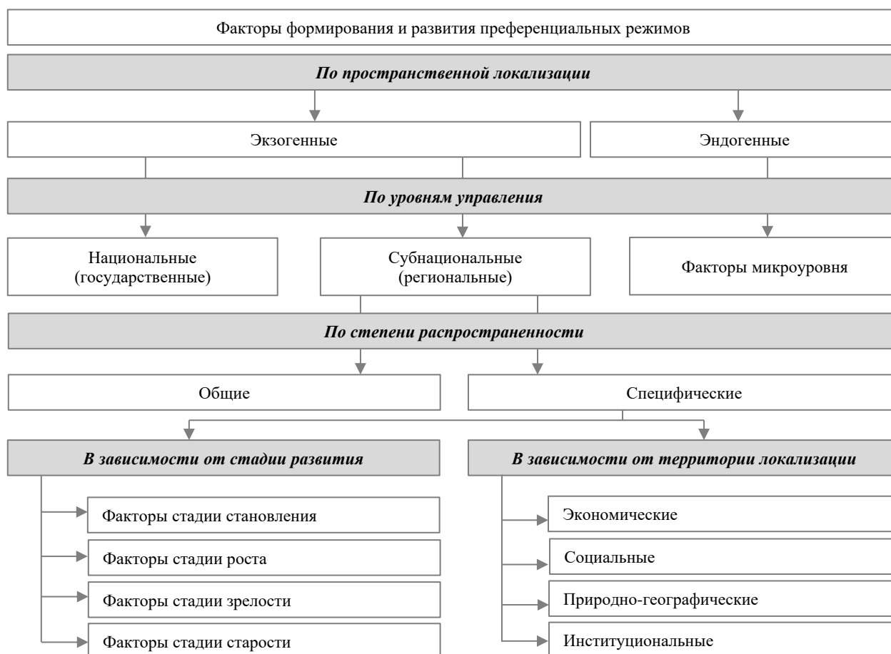
Рисунок 2. Система факторов формирования и развития преференциальных режимов (составлено авторами)

Учитывая вышесказанное, нами предложена система факторов формирования и развития преференциальных режимов в рамках двух основных критериев: по уровням управления и по стадиям их развития (рис. 2).