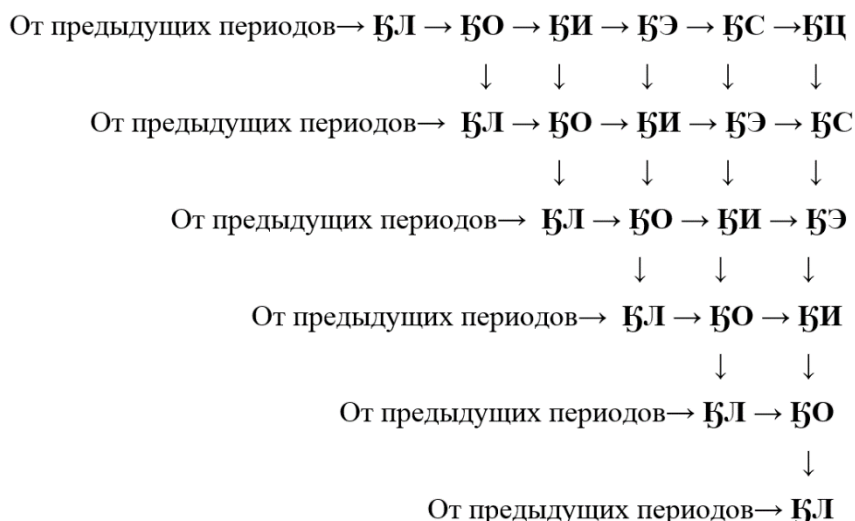
Рисунок 3. К вопросу об иерархометрическом представлении структуры цивилизационно-ориентированного государства (составлен авторами)

Объединение этих структур позволяет дать иерархометрическое представление о структуре цивилизационно-ориентированного государства (рис. 3).