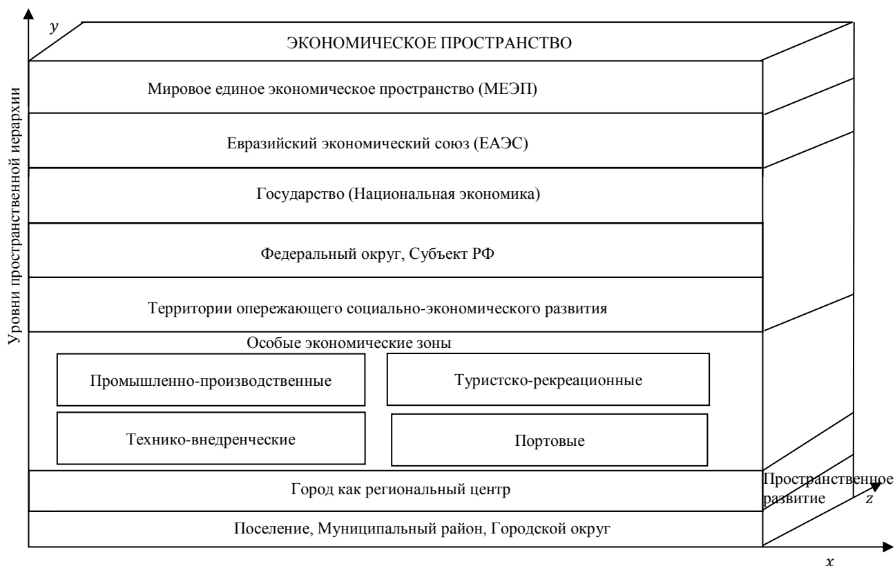
Рисунок 1. Структура экономического пространства России (составлено/разработано автором)