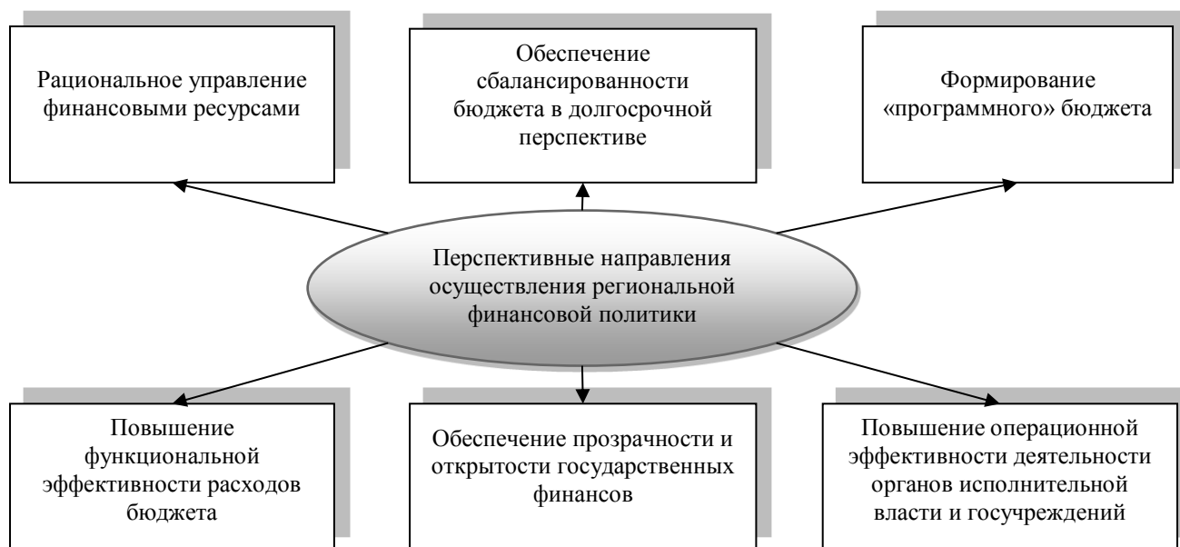
Рисунок 3. Перспективные направления осуществления финансовой политики Ростовской области (рисунок автора)

Думается, что осуществление на практике названных направлений финансовой политики рассматриваемого субъекта Российской Федерации будет содействовать в конечном счете поступательному росту экономики такого региона как Ростовская область.