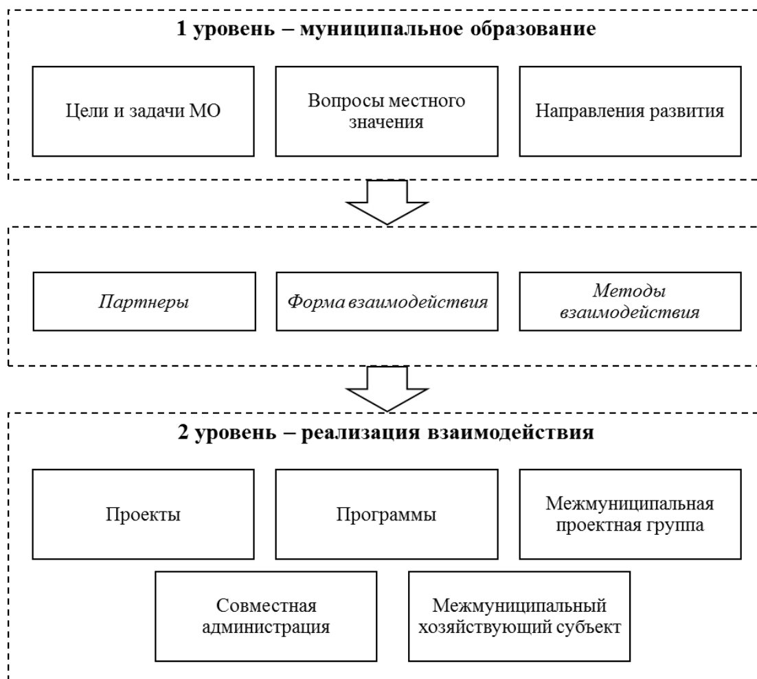
Рисунок 2. Модель межмуниципального взаимодействия (разработано автором)

решаемые вопросы местного значения, направления его развития. Партнеры, формы и методы взаимодействия для решения вопросов развития и функционирования являются основой организации межмуниципального взаимодействия. Второй уровень – реализация межмуниципального взаимодействия, проекты, программы, совместное управление и реализация проектов первого уровня (рис. 2).