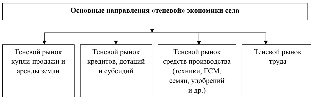
Рисунок 2. Основные направления «теневой» экономики села (разработано автором)

С этих позиций экономика села может также классифицироваться на формальную, официально регистрируемую органами власти и неформальную, «теневую», которая часто не поддается четкому измерению и анализу (рис. 2).