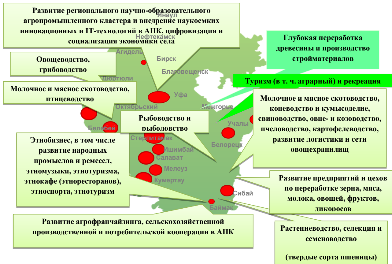
Рисунок 4. Перспективные «точки роста» экономики сельских территорий Республики Башкортостан (разработано автором)

На рисунке 4 представлены наиболее перспективные «точки роста» экономики сельских районов Республики Башкортостан. Среди них, наряду с традиционными для республики отраслями АПК (зерноводство, молочное и мясное скотоводство, коневодство, птицеводство, пчеловодство и др.) нами выделены имеющие хорошие перспективы различные виды туризма (включая аграрный), овощеводство, грибоводство, развитие предприятий по глубокой переработке зерна, молока, мяса, овощей, фруктов и дикоросов.