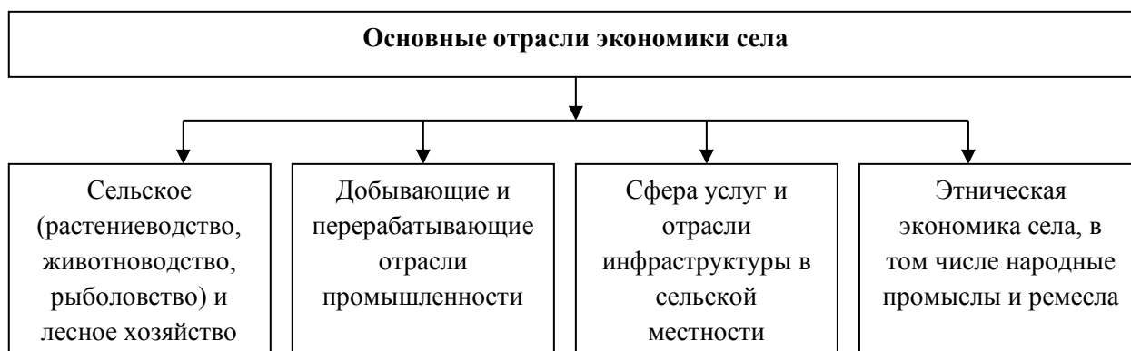
Рисунок 1. Основные отрасли экономики села (разработано автором)

Для предметного анализа современного состояния и перспектив диверсификации сельской экономики необходимо разграничивать понятия «экономика села» и «аграрная экономика», «сельское хозяйство», которые не являются тождественными (рис. 1).