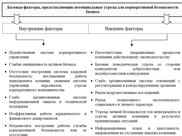
Рисунок 1. Базовые факторы, представляющие потенциальные угрозы для корпоративной безопасности бизнеса (составлено авторами)

Указанные внешние и внутренние факторы, представляющие потенциальные угрозы для корпоративной безопасности бизнеса, обуславливают дополнительные требования к построению системы защиты.