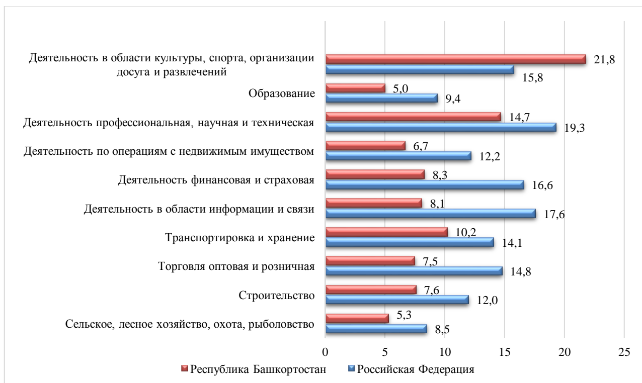
Рисунок 3. Дифференциация в оплате труда работников по видам экономической деятельности (по данным выборочного обследования в апреле 2019 года), коэффициенты фондов (составлено автором на основе данных статистического сборника Республика Башкортостан в цифрах. 2019)

Дифференциация заработной платы в республике по видам экономической деятельности представлена на рисунке 3.