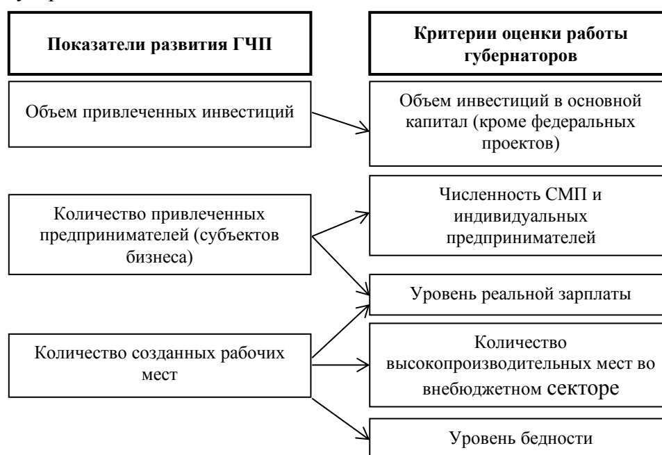
Рисунок 3. Связь результатов реализации механизма ГЧП и критериев оценки работы губернаторов (составлен авторами по данным Минэкономразвития Калужской области 4 и Указа Президента РФ 5 )

В-третьих, успешность реализации механизма государственно-частного партнерства имеет тесную связь с критериями оценки работы губернаторов (см. рис. 3). Поэтому руководители регионов имеют прямой профессиональный и репутационный интерес в усилении государственно-частного симбиоза.