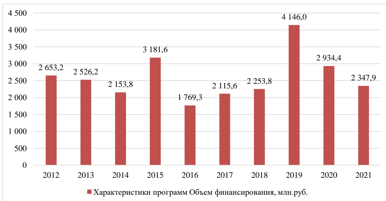
Рисунок 2. Динамика объемов финансирования Союзных государственных программ 2

Как видно на рисунках, за исследуемый период имеет место динамика снижения количества и объемов финансирования реализуемых Союзных государственных программ. В качестве основных причин такого снижения, по нашему мнению, являются: