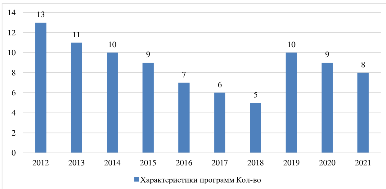
Рисунок 1. Динамика количества Союзных государственных программ 2