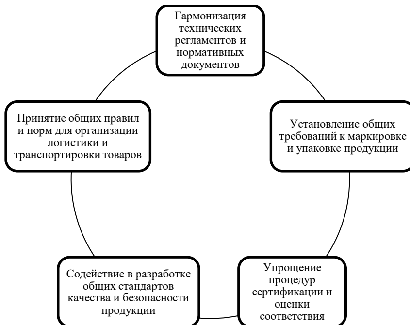
Рисунок 2. Единые стандарты и нормы для участников союза (разработано авторами)

Данные стандарты и нормы способствуют снижению бюрократических барьеров, повышают эффективность цепи поставок продовольственных товаров и улучшают их конкурентоспособность на рынке ЕАЭС. Они помогают обеспечить совместимость продовольственных товаров, облегчают торговлю между странами-членами, упрощают процедуры таможенного контроля и улучшают качество продукции.