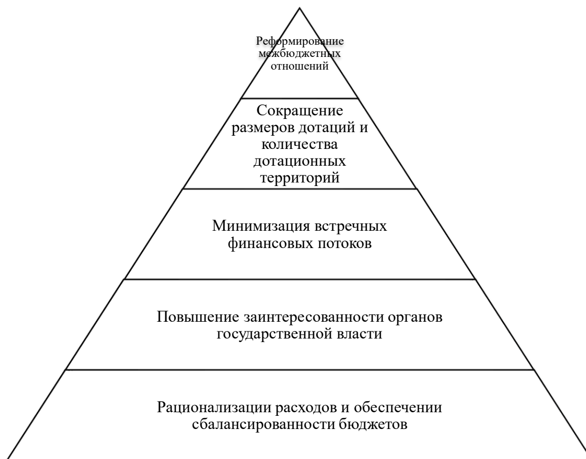
Рисунок 3. Схема реформирования межбюджетных отношений (1996 г.) 1

Также в 2019 г. была принята «Стратегия пространственного развития Российской Федерации на период до 2025 года» 2 . В Стратегии мы уже находим понятия «агропромышленный центр», «геостратегическая территория РФ», «крупная городская агломерация» с общей численностью населения от 500000 человек до 1 млн человек, в которые объединены как инфраструктурой, так и экономическими, социальными, культурными связями. Крупнейшая агломерация — это уже агломерация более 1 млн человек — это уже не просто объединение, а «минерально-сырьевой центр».