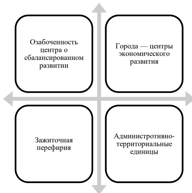
Рисунок 4. Направления сбалансированности экономического развития

Также новое сбалансированное развитие начинается с использования технологий, которые не подчеркивают децентрализующий потенциал в стране, а скорее наоборот — происходит соединение регионов на основе новых технологий. Эта версия уходит своими корнями в политэкономическую традицию, и исследует, как крупные компании используют технологии в своих производственных и распределительных структурах и стратегиях. Здесь нет неизбежность того, что из этих конкурентных стратегий последует децентрализация; однако, новые технологии позволяют регионам использовать более дешевые места производств и потребления (рис. 4).