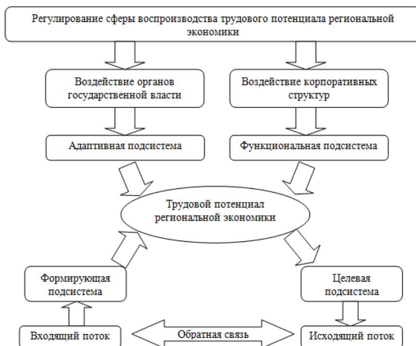
Рисунок 1. Интеграционная модель системы воспроизводства трудового потенциала (составлено автором)

На рисунке 1 представлена интеграционная модель системы воспроизводства трудового потенциала в условиях экономики региона, которая включает в себя элементы формирующей и целевой, а также адаптивной и функциональной подсистем.