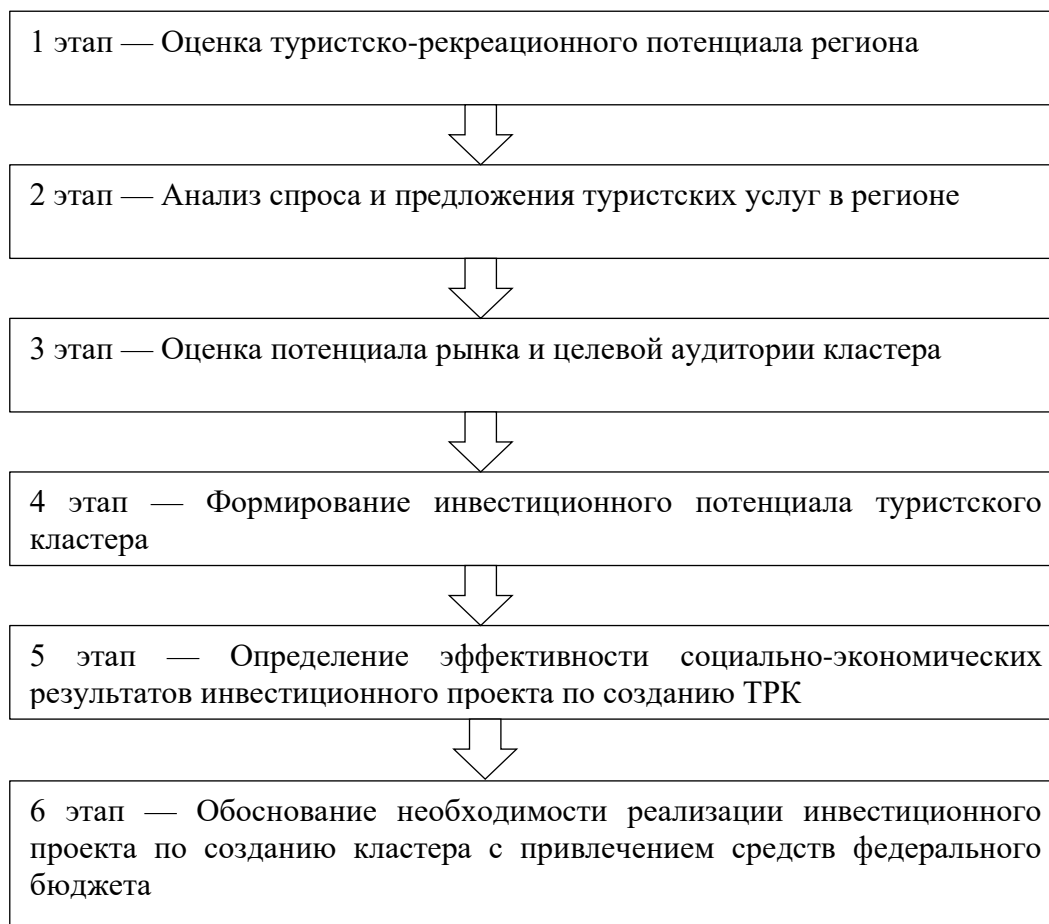
Рисунок 1. Механизм формирования туристского кластера [5]

Эффективный механизм устойчивого развития региона на основе формирования туристического кластера включает несколько этапов (рис. 1).