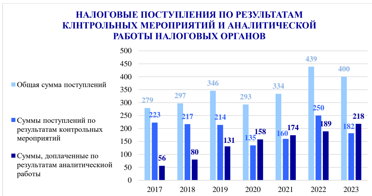
Рисунок 2. Налоговые поступления по результатам налогового администрирования 7

Предпроверочный анализ в большей степени стал осуществляться взамен выездных налоговых проверок уже с 2020 года. По данным ФНС РФ, в 2023 году предпроверочный анализ принес дополнительно в бюджет 218 млрд руб., контрольные мероприятия позволили дополнительно привлечь 182 млрд руб. (рис. 2).